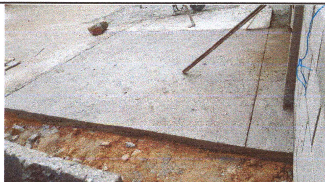
Foto 4. Torta de cemento de 3 metros por 4