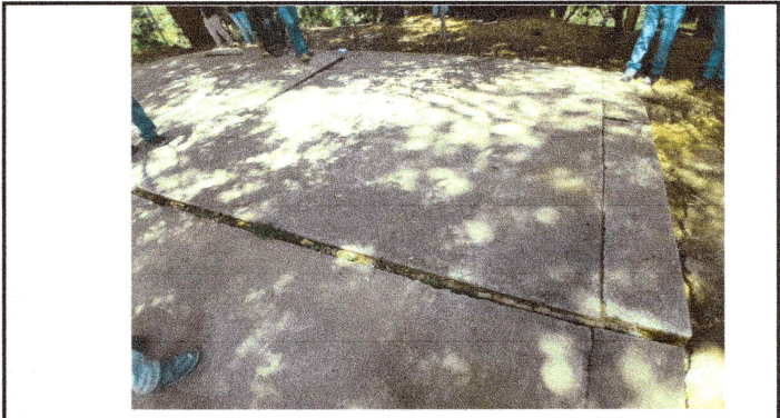
Foto: 4 Sustitución de pavimento de cancha