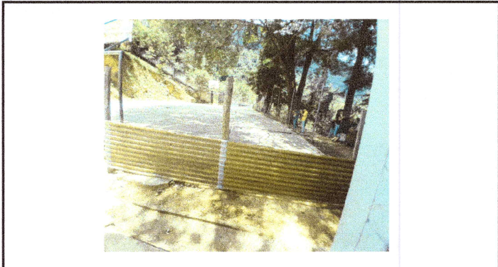
Foto 1. Circulación de cancha polideportiva