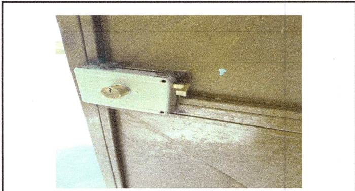
Foto 3 Sustitución de chapa de puerta de metal