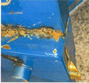
Foto 1. Sustitución de chapas