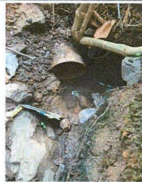
Foto 4. Sustitución de tubo pvc línea principal de aguas negras