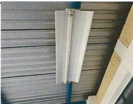
Foto 5. Sustitución de lámparas