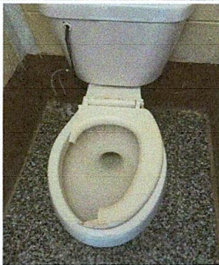
Foto 3. Sustitución de accesorios de baño