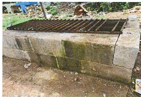
Foto 6. Sustitución de Estufa Rural Completa

Observación: Si es necesario se pueden agregar hojas adicionales y actualizar el número de hojas.