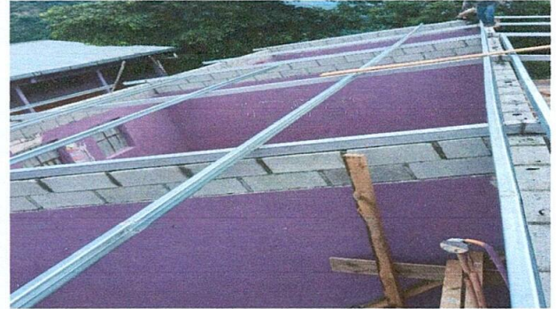
Foto 2: Cambio de lamina troquelada calibre 26 y estructura portante de madera por metal.