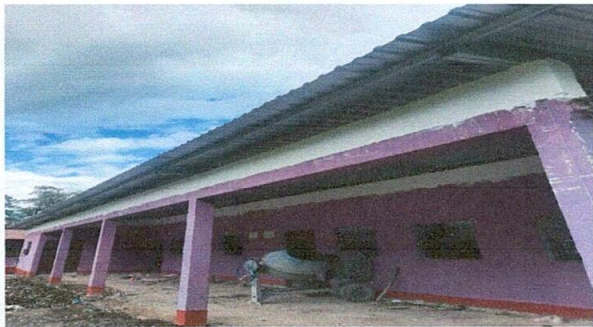
Foto 5: Colocación de piso de concreto en el corredor de las aulas.