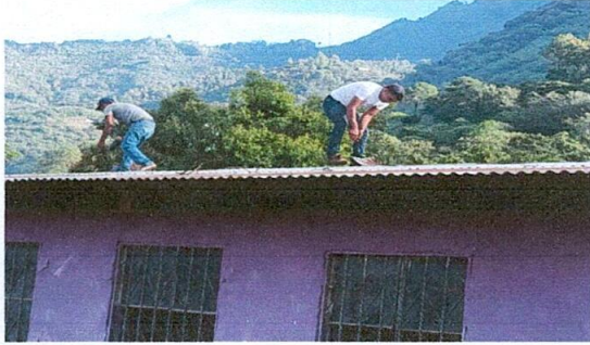
Foto1: Cambio de lámina