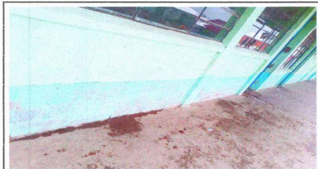
Foto 3: Pintura en muros exterior e inferior (pintada del establecimiento)