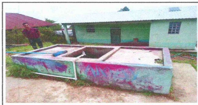
FOTO 5: Reparación y mantenimiento de cisterna/depósito de agua (cambio de paredes de block a concreto con repello)