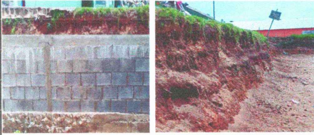
Foto 7: Reparación del muro de contención (foto 1 trabajo hecho por la comunidad, foto 2 trabajo pendiente del muro de contención)

Observación: Si es necesario se pueden agregar hojas adicionales y actualizar el número de hojas.