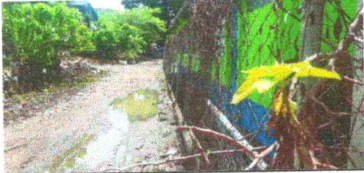
Foto 7: Reparación de muro perimetral de blok con tubo hg y malla galvanizada, soleras intermedias y columnas.