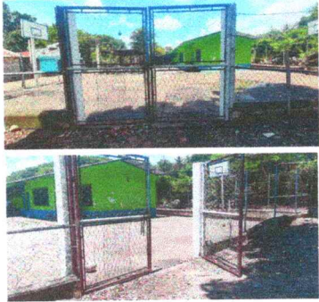
Foto1: Sustitución de portón de metal.