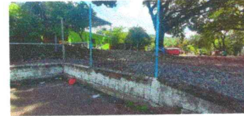
Foto 8: Reparación de muro perimetral de blok con tubo hg y malla galvanizada, soleras intermedias y columnas.

Observación: Si es necesario se pueden agregar hojas adicionales y actualizar el número de hojas.