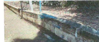
Foto 6: Reparación de muro perimetral de blok con tubo hg y malla galvanizada, soleras intermedias y columnas.

Observación: Si es necesario se pueden agregar hojas adicionales y actualizar el número de hojas.