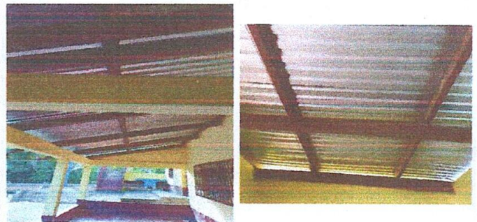
FOTO 4. REPARACIÓN DE ESTRUCTURA DE TECHO