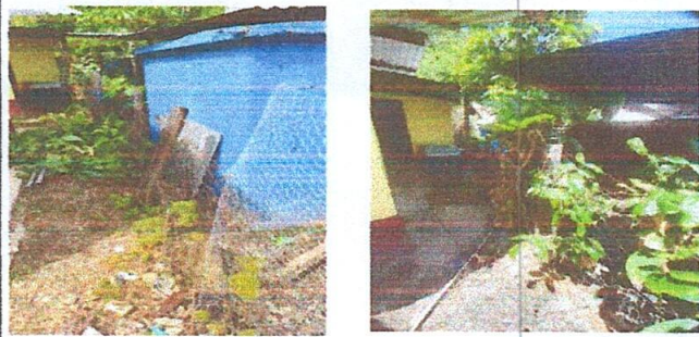
3. REPARACIÓN DE MURO PERIMETRAL