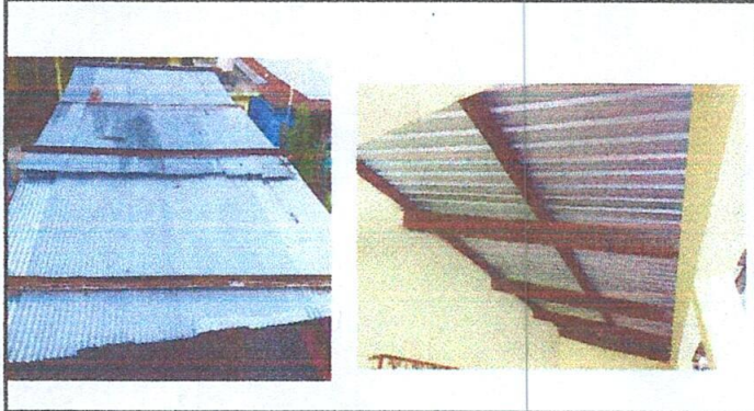
FOTO 1. SUSTITUCIÓN DE CUBIERTA DE LÁMINA