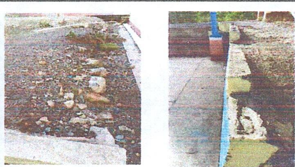
FOTO 2. REPARACIÓN DE MURO DE CONTENCIÓN