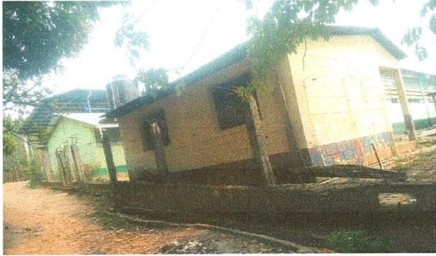
Foto 1 Sustitución de cerco de malla, por muro perimetral de block.