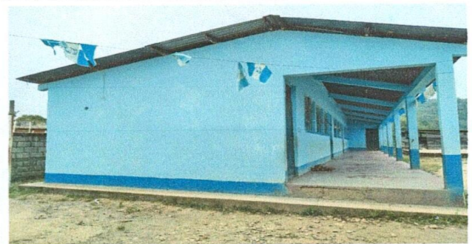
Foto 6 Pintura en muros exteriores e interiores.

Observación: Si es necesario se pueden agregar hojas adicionales y actualizar el número de hojas.