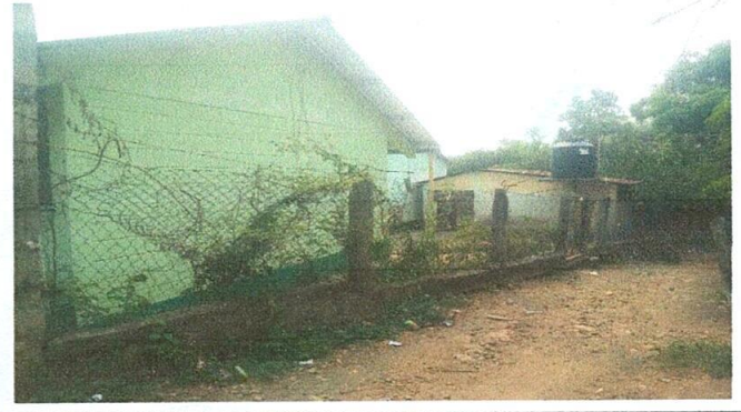
Foto 2 Circulación en mal estado.