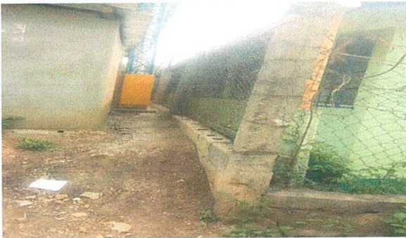
Foto 3 Circulación en mal estado.