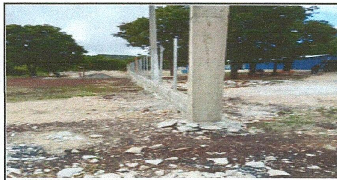
Foto 5: parte de enfrente del muro perimetral con block y tubo galvanizado