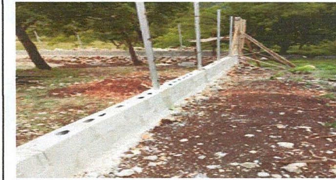
Foto1: muro de block y fundición de tubos galvanizados