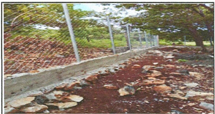
Foto 6: colocación de la maya en el muro y tubos galvanizados en la parte de atrás del predio escolar

Observación: Si es necesario se pueden agregar hojas adicionales y actualizar el número de hojas.