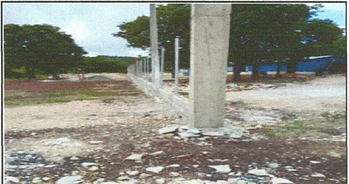
Foto 4: columna donde se colocara el porton de la entrada principal