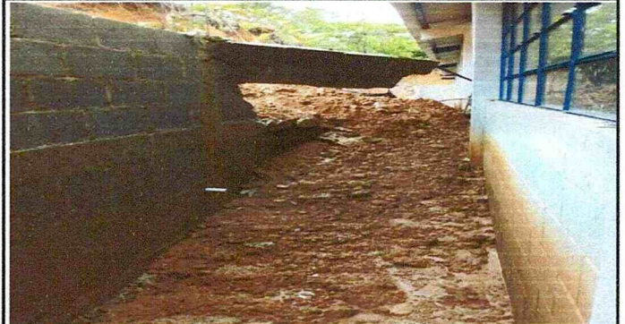
Foto 2. Muro de Contención en malas condiciones.