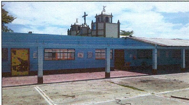
Foto 1: INICIO DE TRABAJOS PRIMERA FASE: TRES AULAS DEL CENTRO EDUCATIVO