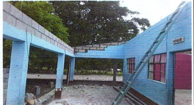
Foto 2: INCREMENTO DE LA ALTURA DE LAS PAREDES FRONTALES Y LATERALES DEL CENTRO EDUCATIVO