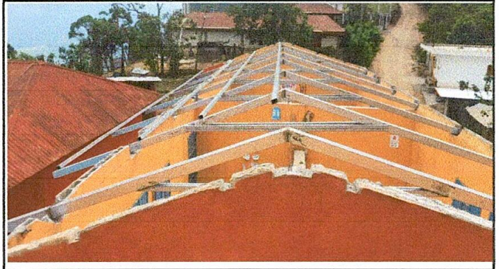
Foto 2: Sustitución de estructura de soporte de madera, por metal