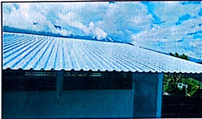
Foto1: Lámina, estructura en buenas condicines