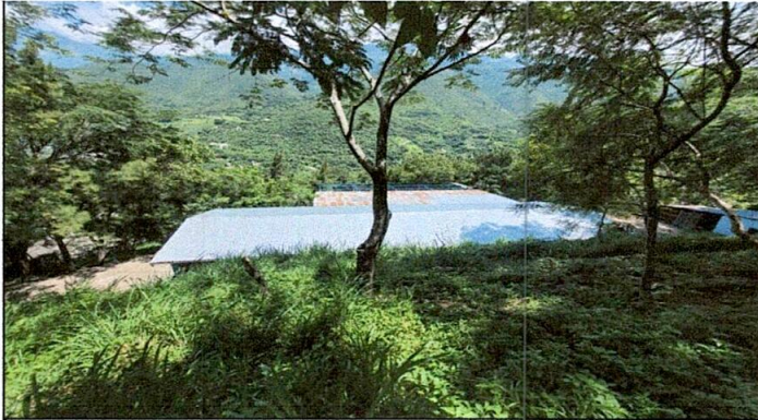
Foto1: colocación completa del techo de lámina troquelada.