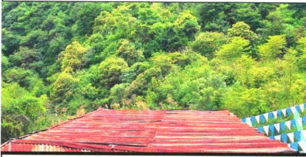
Foto1: Cubierta de lámina, lámina oxidada y con agujeros