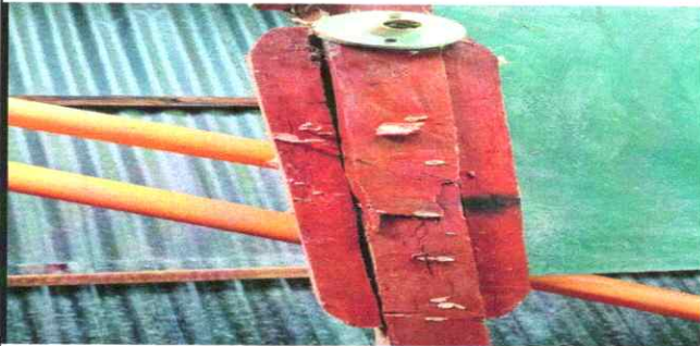
foto3: Tendales añadidas y apolilladas