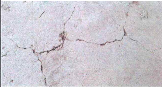
Foto7: Piso agrietado