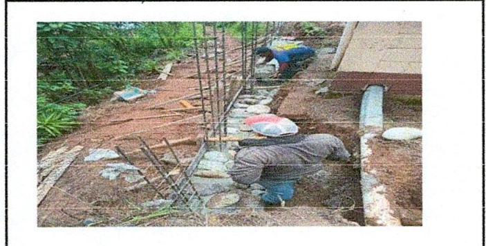
Foto 6. Parte del muro recién fundido con su respectiva formaleta.

Observación: Si es necesario se pueden agregar hojas adicionales y actualizar el número de hojas.