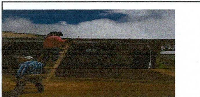
Foto 3. Soldando canaletas de metal