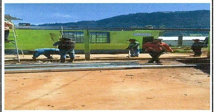
Foto 2 Soldando costaneras e instalando los tubulares.