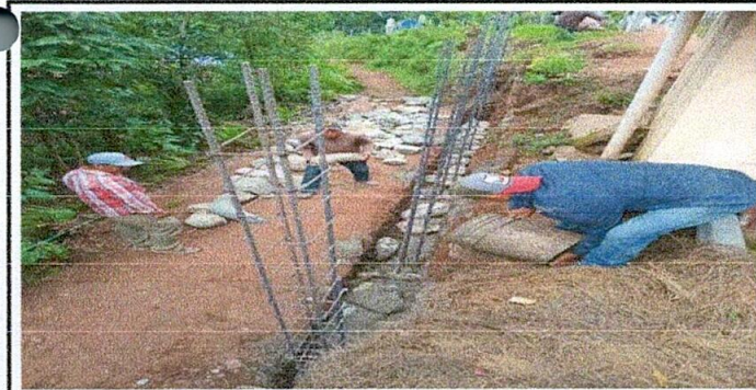
Foto 5. Fundiendo cimiento del muro con piedra, cemento y hierro.