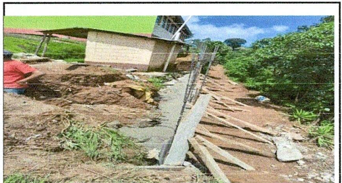
Foto 4. reparación del muro en proceso.