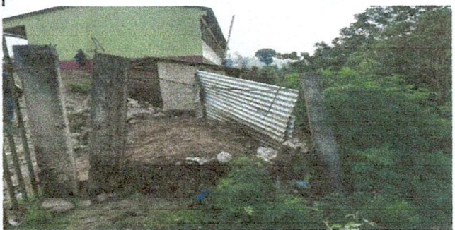
Foto 4. reparaçión de muro perimetral