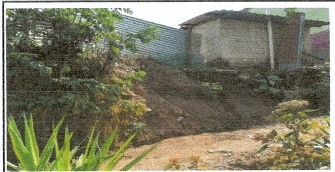
Foto 6. Reparación de muro perimetral

Observación: Si es necesario se pueden agregar hojas adicionales y actualizar el número de hojas.