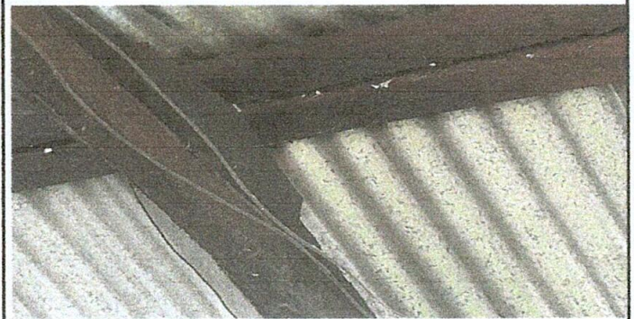
Foto2. sustitución de soporte de madera por metal