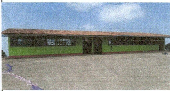
Foto 3. sustitucion de canaletas de metal