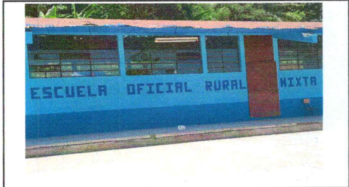
Foto1: Sustitución de lámina en aulas