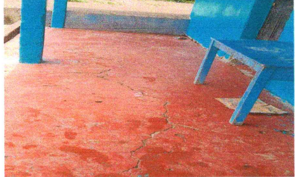
Foto 8: Sustitucion de piso por piso de granito en cocina escolar (exterior) corredor