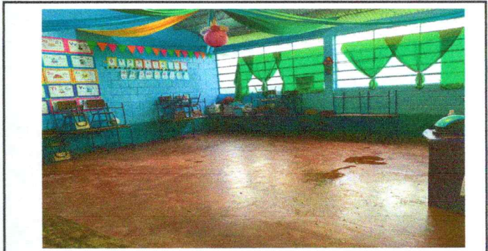
Foto 6: Sustitución de piso por piso de granito en corredor de aulas

Observación: Si es necesario se pueden agregar hojas adicionales y actualizar el número de hojas.