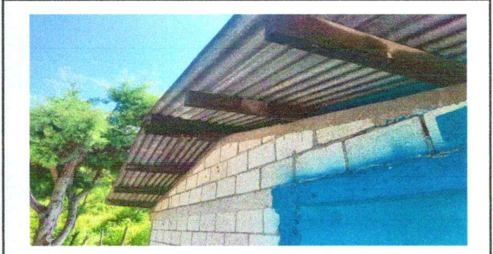
Foto 4: Sustitucion de estructura de soporte de madera por metal en techo de cocina escolar