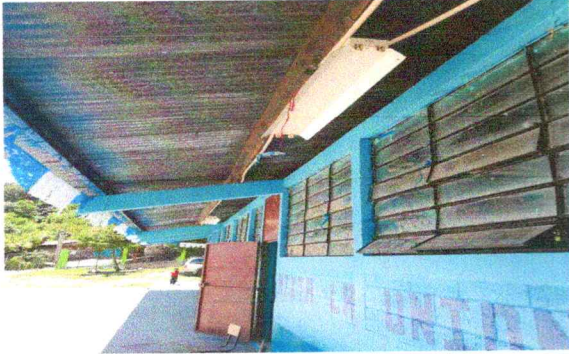
Foto13: Sustrucción de focos ahorradores