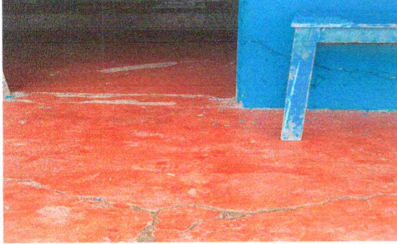
Foto7: Sustitucion de piso por piso de granito en cocina escolar (interior)