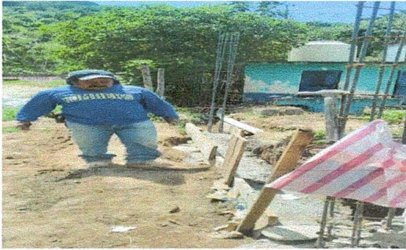
Foto1: Lado Este construcción de circulación que estaba en mal estado