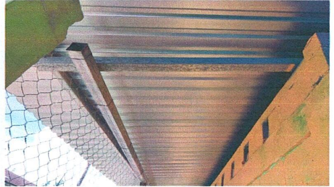
Foto 2: Sustitución de estructura de soporte de madera, por metal.