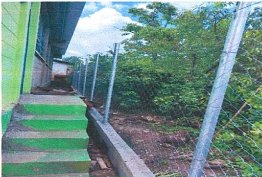
Foto 5: Reparación de muro perimetral de block con tubo hg y malla.