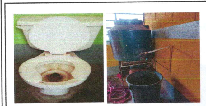
Foto 5: Sanitarios detereorados y llaves de chorros en mal estado