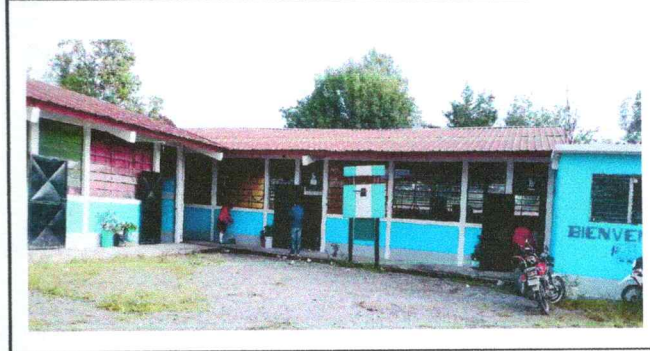
Foto 4: Ventanales expuestos rompen vidrios y cabe una persona se necesitan valcones