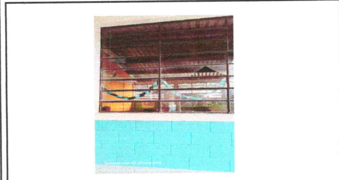
Foto 3: Ventanales expuestos rompen vidrios y cabe una persona se necesitan valcones