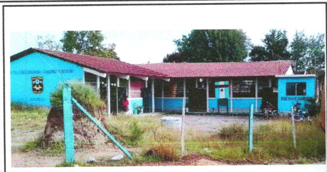
Foto1: Lámina en mal estado