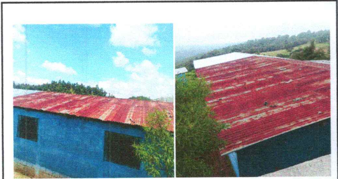
Foto1: Cubierta de lámina deteteriorada