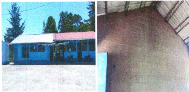
Foto 3: Pintura del centro educativo deteoroada y partes que no cuentan con pintura