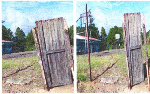
Foto1: Portón de madera en completamente deteorado