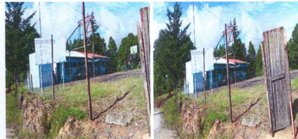
Foto 4: Muro perimetral deteoroado e inseguro, en todo el costado del centro educativo y entrada existe carretera de vía pública transitada