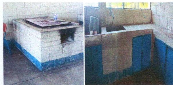
Foto 6: Estufa rural en mal estado y muebles de concreto de cocina sin protección

Observación: Si es necesario se pueden agregar hojas adicionales y actualizar el número de hojas.