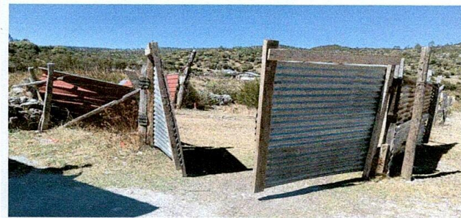
SUSTITUCION DE PORTON DE LAMINA POR PORTON DE METAL