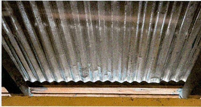
SUSTITUCION DE LAMINA POR LAMINA