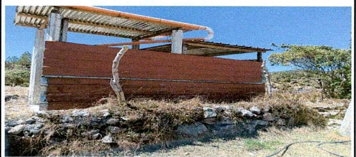
SUSTITUCION DE MURO DE PIEDRA POR MURO DE BLOK, TUBO Y MAYA

Observación: Si es necesario se pueden agregar hojas adicionales y actualizar el número de hojas.