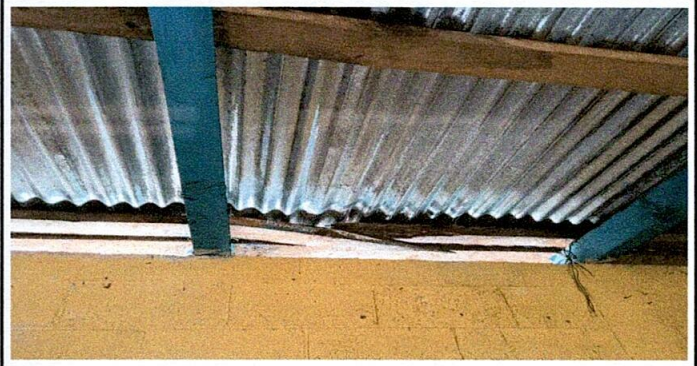
SUSTITUCION DE ESTRUCTURA DE SOPORTE DE TECHO DE MADERA POR METAL