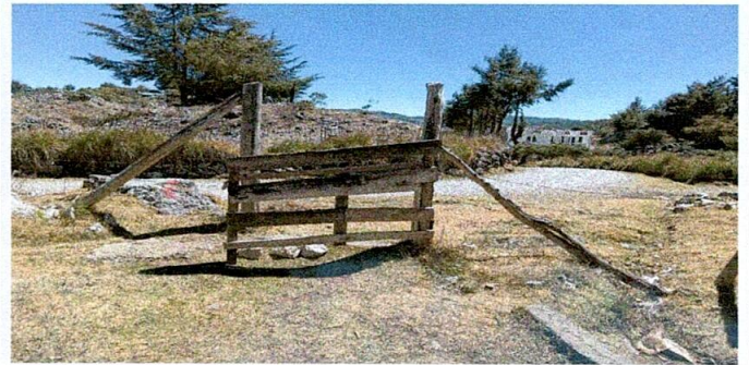
SUSTITUCION DE PUERTA DE MADERA POR PUERTA DE METAL