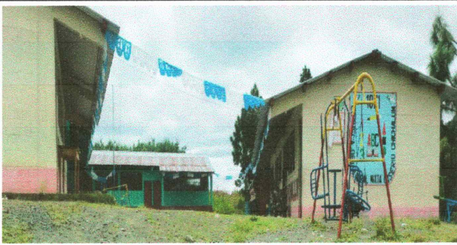
Foto 3: Sustrucción de porton de metal de 5mts de ancho por 2.8 mts de alto