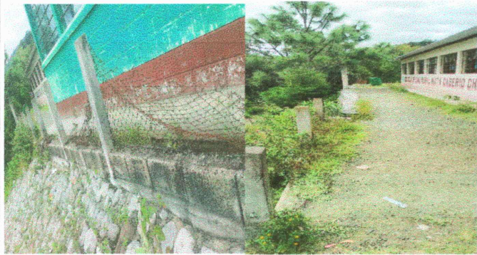
Foto 1: Sustrucción de muro perimetral de block y malla por muro perimetral de block con tubo hg y malla galvanizada, soleras intermedias y columnas