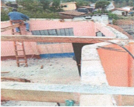
Foto 1: Nivelación del aula utilizando block, preparandola para la colocación del techo nuevo.