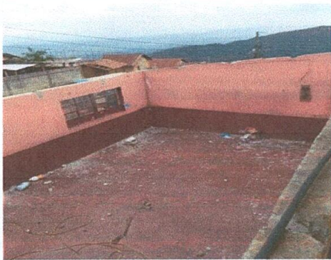
Foto 3: retiro del techo y estructura del aula en el segundo nivel del establecimiento