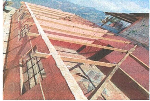
Foto 2: Desmantelamiento de la esytrutura de madera de las aulas para colocar la estructura de metal.