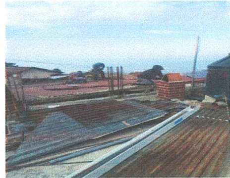
Foto 4: Se puede observar el mal estado del techo de las aulas a ser objeto del mantenimiento nuevo.