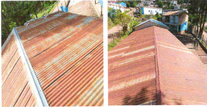
Foto1: Cubierta de Lámina: sustitución de lámina, por lamina troquelada aluzinc calibre 26