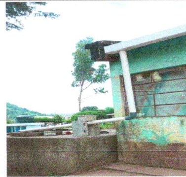
Foto 4: Canales y Bajadas de agua pluvial. Sustitución de canal de PVC, bajas de agua y soportes.