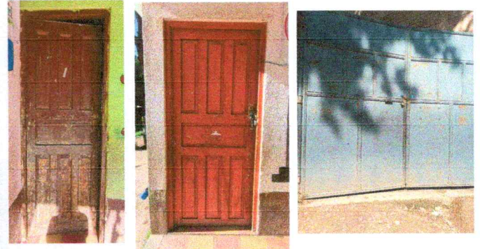
Foto 2: Puertas de Metal: Sustitución de puertas de madera y porton.