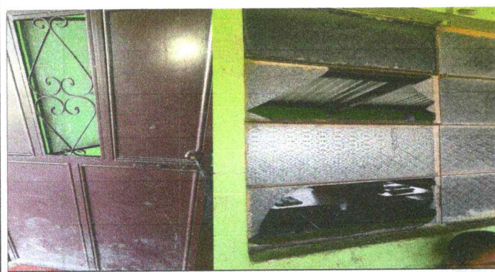
Foto 5: Reparación de puertas, cambio de chapas, sustitución de vidrios y sustitución de ventanas de metal por metal