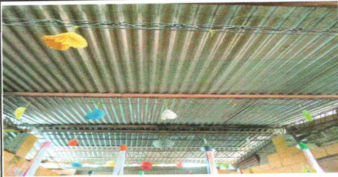
Foto1: Sustitución de lámina, por lamina troquelada Aluzinc calibre 26