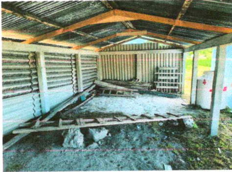
Foto1: CUBIERTA DE LAMINA