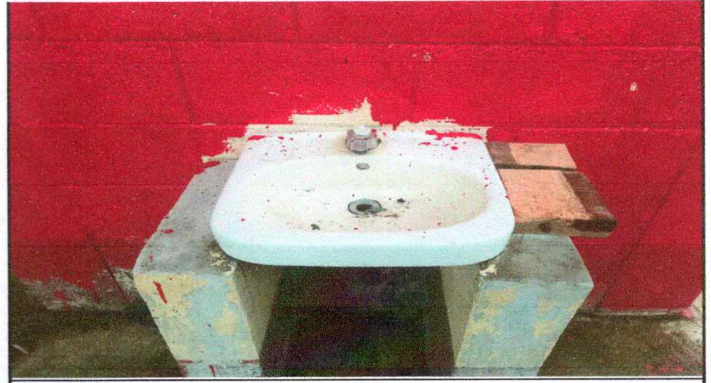
Foto 2: Lavamanos manchados y sin funcionamiento ya que no se cuenta con agua potable y no cuenta con sus accesorios