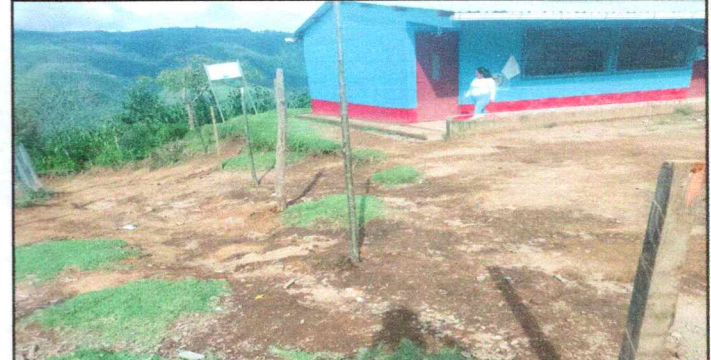
Foto 6: Lugar donde se colocará la malla perimetral para delimitar el espacio de la escuela

Observación: Si es necesario se pueden agregar hojas adicionales y actualizar el número de hojas.