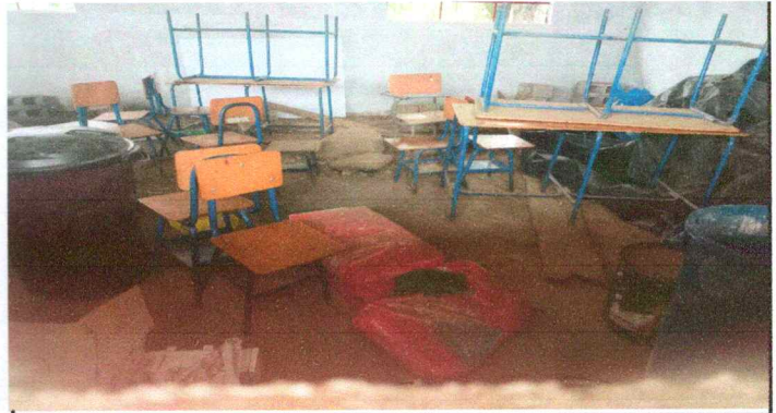
Foto 4: Piso del aula en mal estado, provocando lesiones en los alumnos del establecimiento