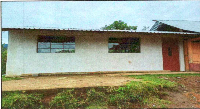
Foto1: Parte frontal del aula donde se colocarán los balcones