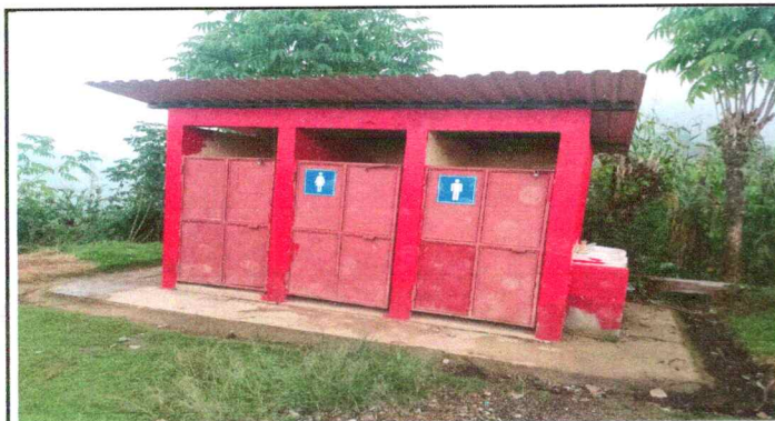
Foto 3: Colocacion de rotoplas ya que los sanitarios no cuentan con agua