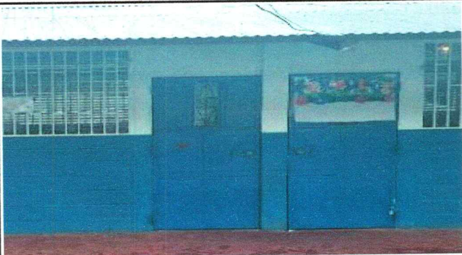
Foto 3: Mantenimiento de estructura de puertas de metal (corte, lijado, cepillado, pintura)