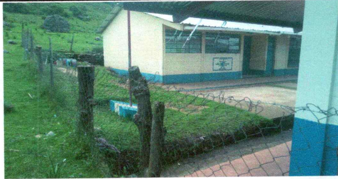
Foto 1: Sustitución de muro perimetral de postes de madera y malla por muro perimetral de block con tubo hg y malla galvanizada, soleras intermedias y columnas