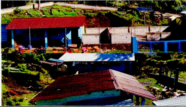
Foto1: Es primordial cambio de techo en mal estado donde hay fugas de agua a causa de las lluvias.