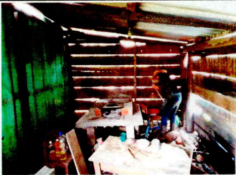
Foto 5: Es necesario colocar azulejo en la estufa rural para un adecuado uso higiénico en la preparación de alimentos.