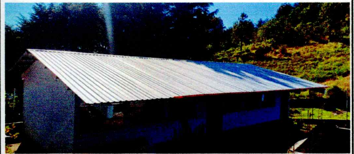
Foto 4: Es necesario colocar canales reforzados para la captación y aprovechamiento de agua en cisterna y depósito existentes.