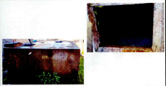
Foto 6: Se debe colocar azulejo en fuga de agua en la base de la sisterna para el aprovechamiento del vital líquido.

Observación: Si es necesario se pueden agregar hojas adicionales y actualizar el número de hojas.