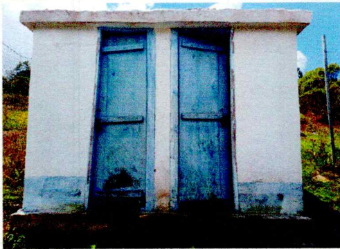
Foto 3: La sustitución de puertas de metal son necesarias en los servicios sanitarios.