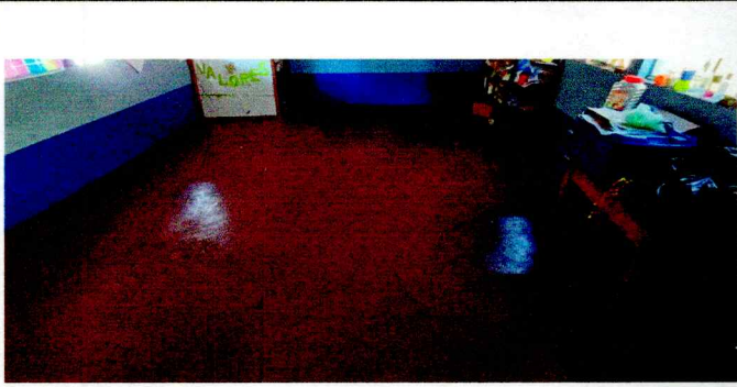
Foto 7: Se debe sustituir piso granito, debido al deterioro con grietas en el aula.