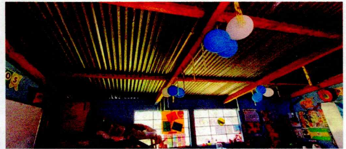
Foto 2: Es necesario sustituir estructura de madera por metal debido a que se encuentran en mal estado.