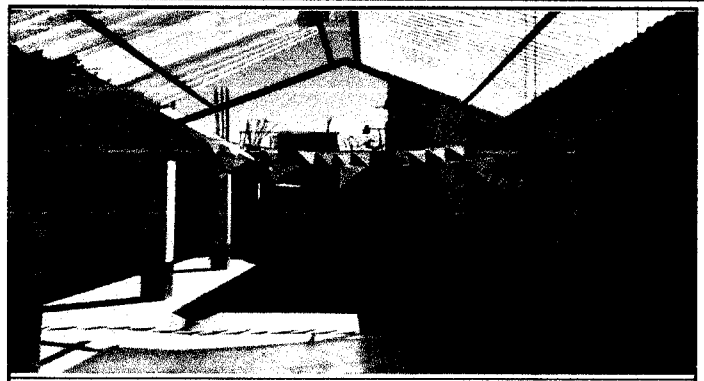
Foto. 2 sustitución de techo, lámina por lámina