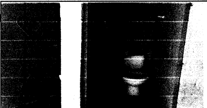
Foto 5: Sanitario, mejoramiento de paredes, cambio de inodoros, sustitución de torta por piso de granito, colocación de azulejo en 1 metro de paredes