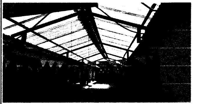
Foto 3. Sustitución de canal pluvial, sustitución de focos y plafoneras, cambio de cableado.