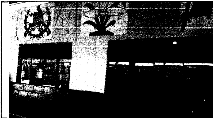
Foto 1, sustitución de ventanas de hierro por PVC , aplicación pintura en interior y exterior