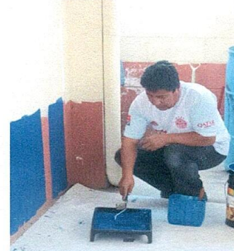
Foto 10: Aplicación de pintura de agua y aceite a paredes interior