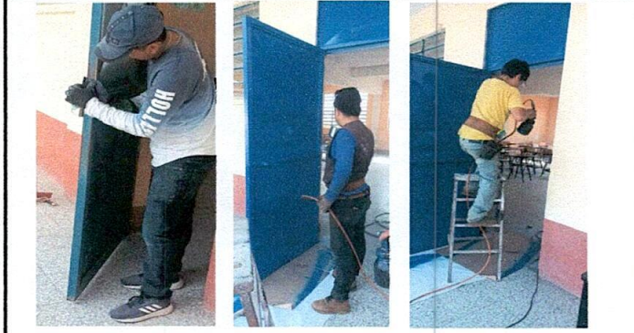
Foto1: Mantenimiento a estructura de puertas de metal (lijado y aplicación de pintura de aceite).