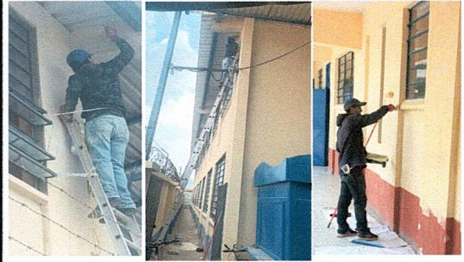
Foto 8: Aplicación de pintura de agua y de aceite a paredes exterior