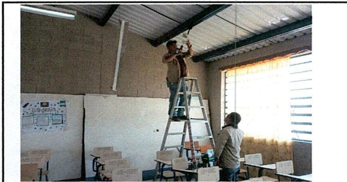
Foto 5: Sustitución bases de lámpara fluorescentes a plafoneras y sustitución de lámparas fluorescentes a bombillas led.