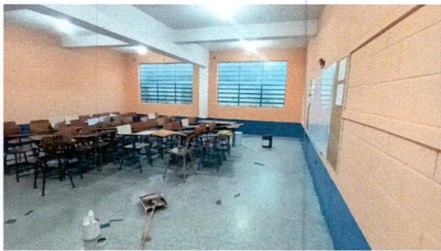
Foto 9: Aplicación de pintura de agua y de aceite a paredes interiores.