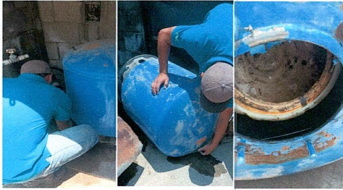
Foto7: Reparación de bomba de agua más accesorios