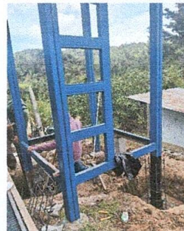
Foto 6: Reforzamiento con concreto de la base de metal para cisterna de agua

Observación: Si es necesario se pueden agregar hojas adicionales y actualizar el número de hojas.