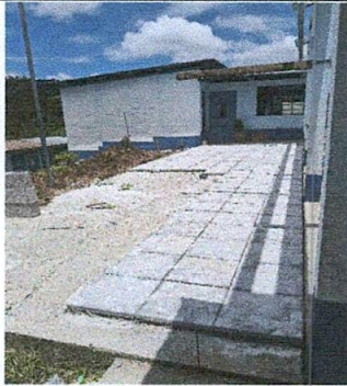
Foto 3: Reparación de planchas de concreto de patio y reforzamiento con muro de contención