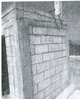
Pared en mal estado