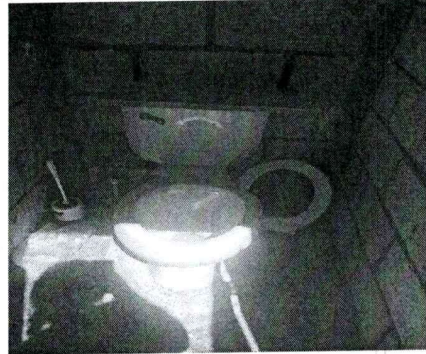
sustitución de sanitarios en mal estado