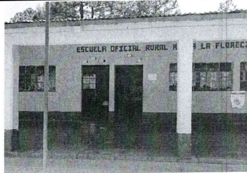
Sustitución de Puertas en mal estado