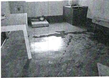
piso de concreto en mal estado