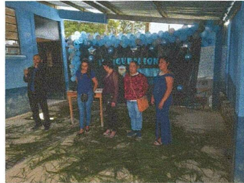
Foto 4: Acto de inauguración de proyecto con OPF del establecimiento