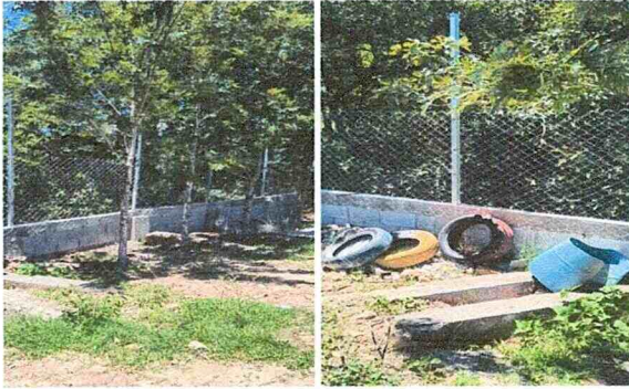
Foto1: Reforzamiento de muro de contención