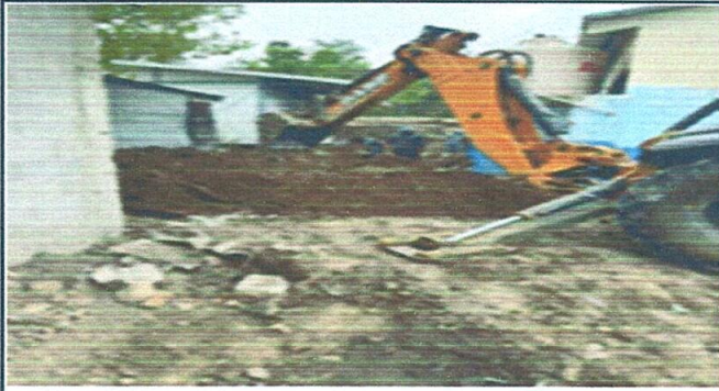
Foto1: MAQUINARIA TRABAJANDO