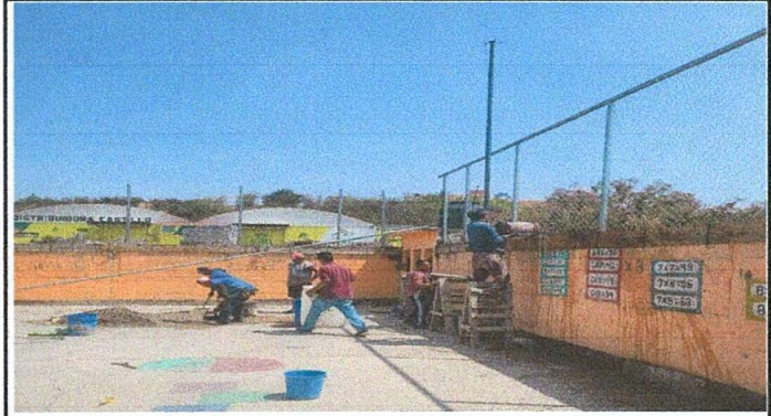
Foto: Reparación de muro perimetral de block con tubo hg malla galvanizada, soleras intermedias y columnas .