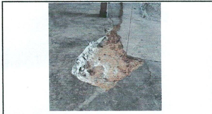
Foto 3: Es necesario la sustitución de piso de granito en modulo 1 y modulo 2 donde el piso de concreto ya esta en mal estado.