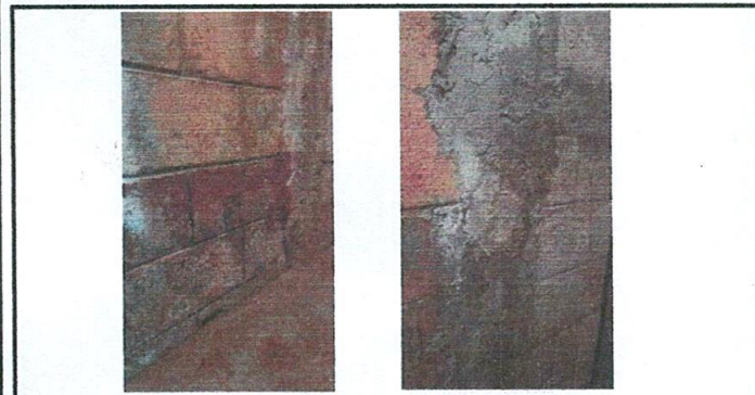
Foto 5: En la cocina se encuentra un muro en malas condiciones por humedad, el cual se debe de demoler y sustituir por muro de block, con cimienta, columnas y soleras