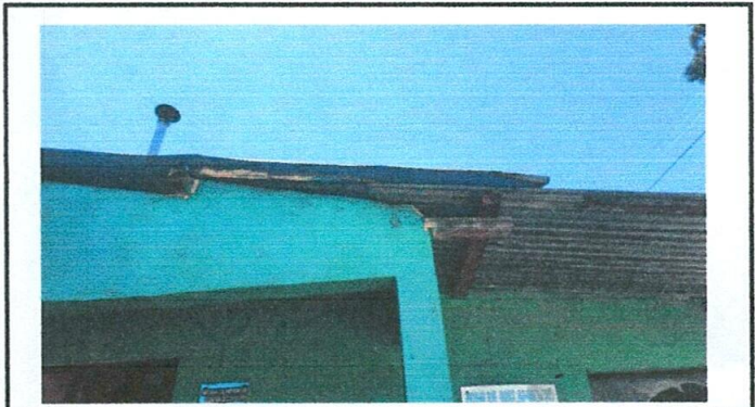
Foto 2: Sustitución de lámina en mal estado, por lámina troquelada calibre 26.