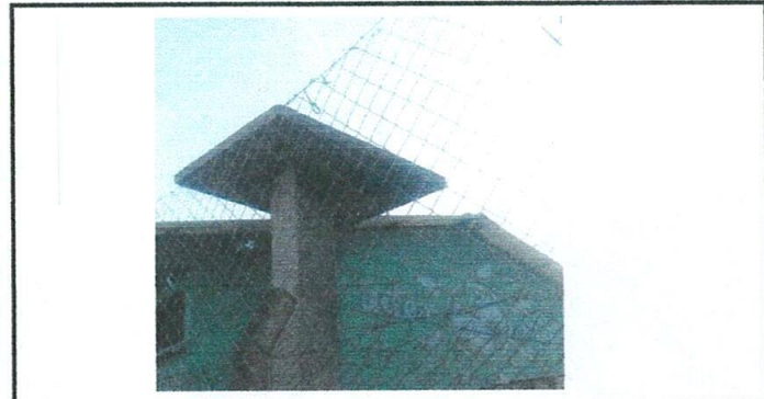
Foto 6: Sustitución de tinaco en la base de concreto para el funcionamiento de la red de agua potable.

Observación: Si es necesario se pueden agregar hojas adicionales y actualizar el número de hojas.