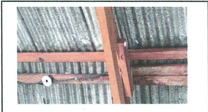
Foto 1: Sustitución de estructura de madera, por metal en modulo 1 que cuentan con un aula y cocina.