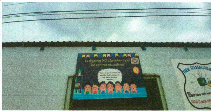
Foto7: Mejoramiento de pintura