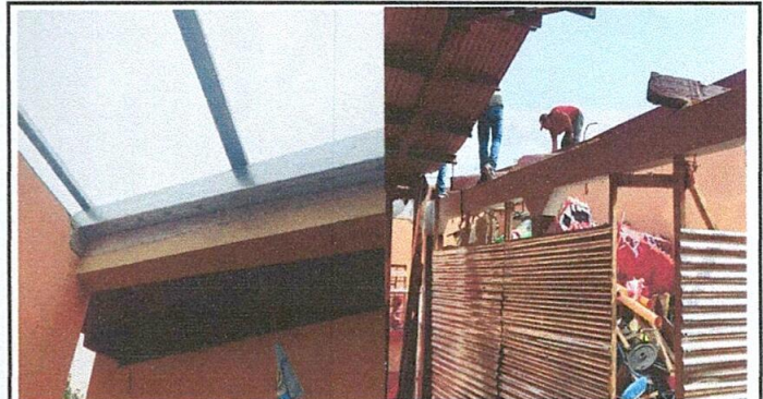
Foto 4: Sustituídos los soportes de madera en mal estado por estructura metálica.