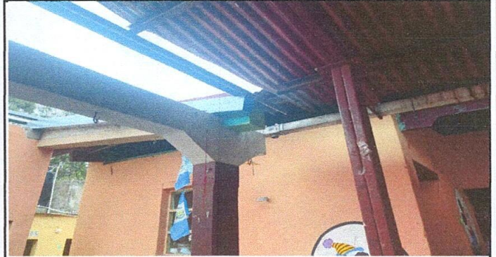
Foto 2: Removida la caída de agua que se encontraba en mal estado.