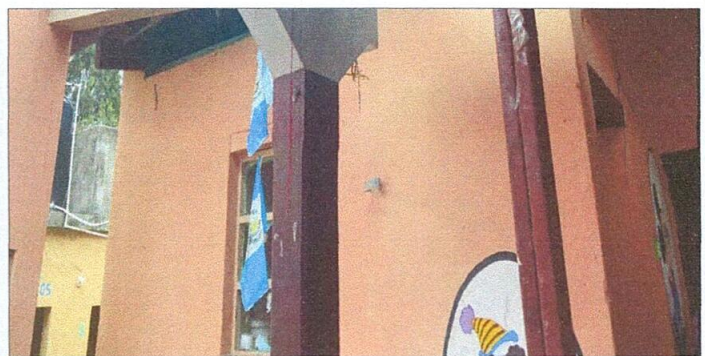
Foto 6: Pintura de interior y exterior en mal estado. PENDIENTE DE EJECUTAR.

Observación: Si es necesario se pueden agregar hojas adicionales y actualizar el número de hojas.