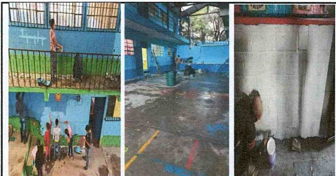
Foto 6: Pintura de parte interna y externa en las instalaciones de la escuela

Observación: Si es necesario se pueden agregar hojas adicionales y actualizar el número de hojas.