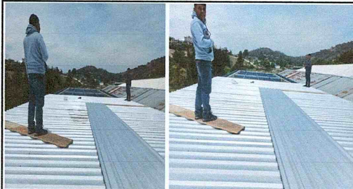
Foto1: Sustitución de láminas de las aulas en el segundo nivel.