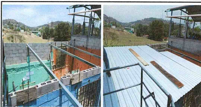
Foto 2: Sustitución de láminas en la cocina y Cambio de estructura de madera a metal.