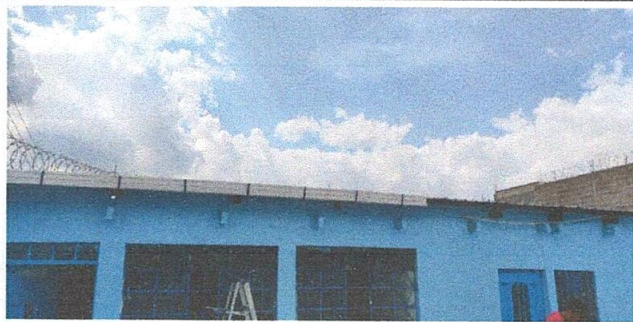
Foto1: Sustitución de canal por PVC