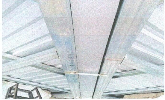
Foto 2: sustitución de estructura y canal intermedio completo módulo 1