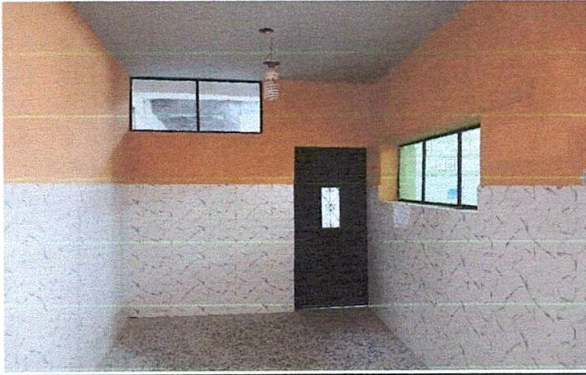
Foto 1: Mejora de paredes, cielo, colocación de azulejo, granito, mejora de puesta y ventanas.