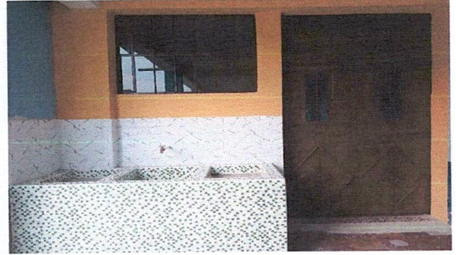
Foto 4: Mejoramiento pila externa, sistema de agua y drenaje para utilización de lavado para los niños y maestros.