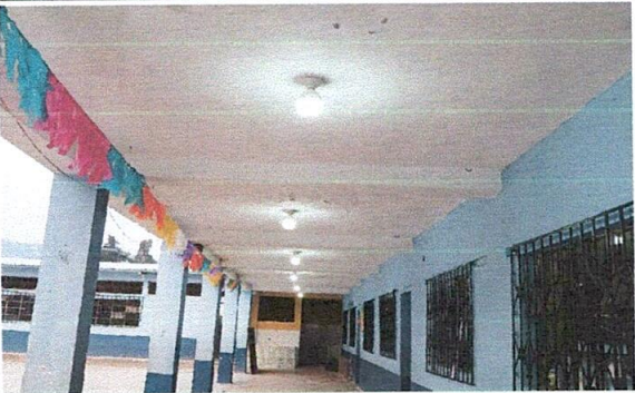
Foto 5: Mejoramiento del sistema eléctrico con cambio de cable en 3 sectores, cambio de bombillas, apagadores y tomacorrientes.