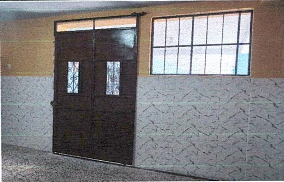
Foto 3: Ampliación de cocina, mejoramiento ventana y porton principal, colocación de azulejo y granito.