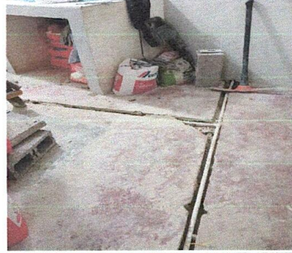
Foto 2: Mejora del sistema de conducción de agua en el ambiente de la cocina.