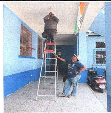
Foto 4: Mejoramiento del sistema eléctrico de la cocina y otros modulos de la escuela.