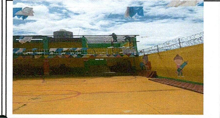
Empezando a quitar techo viejo o dañado en el área de las gradas.