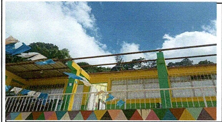
finalizando el levantado de lámina vieja para colocar nueva.