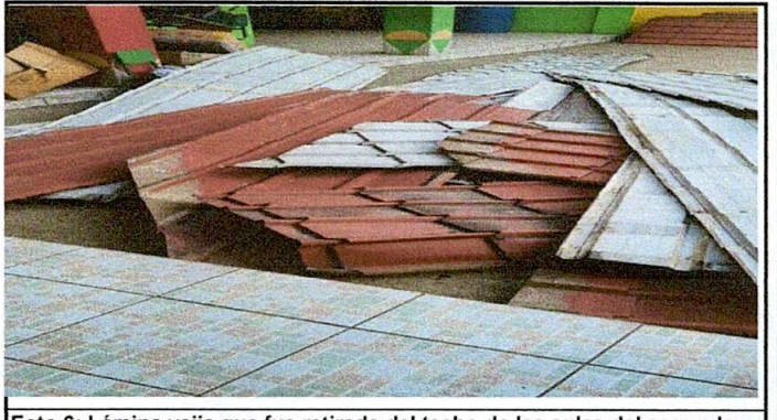
Foto 6: Lámina vieja que fue retirada del techo de las aulas del segundo nivel.

Observación: Si es necesario se pueden agregar hojas adicionales y actualizar el número de hojas.